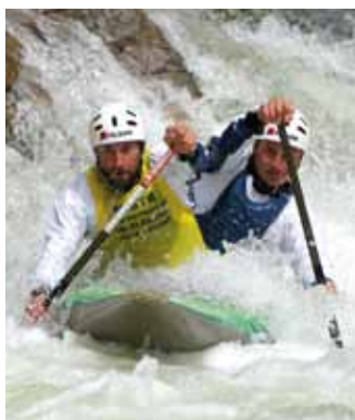
Olympionik Marek Jiras: Děti už neumějí lézt po stromech více na str. 12