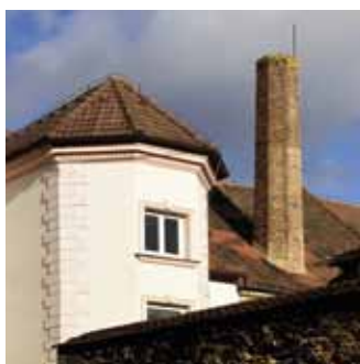
Pivovar v Uhříněvesi znovu ožívá více na str. 8