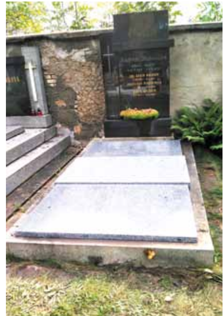
▲ Rodinná hrobka číslo 68 – zde je Jindřich Bubeníček pochován – původní stav – stav po opravě