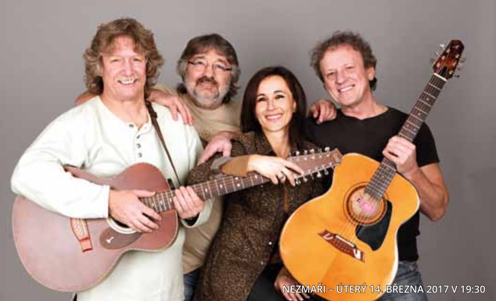
NEZMAŘI – ÚTERÝ 14. BŘEZNA 2017 V 19:30