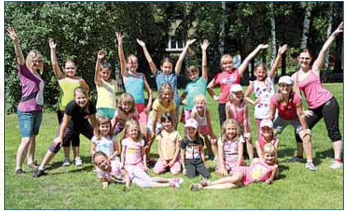
Text a foto: Markéta Petrová

Další ročník oblíbeného příměstského tábora s celodenním programem, tancem a hrami pro děti od 7 do 15 let. Koná se v prostorách Domu UM v Uhříněvsi denně od 8:00 do 17:00 hodin. Cena 1 500 Kč (pro účastníky s trvalým bydlištěm v Praze sleva 250 Kč). V ceně je zahrnuto: program, materiál, obědy, lektorné.