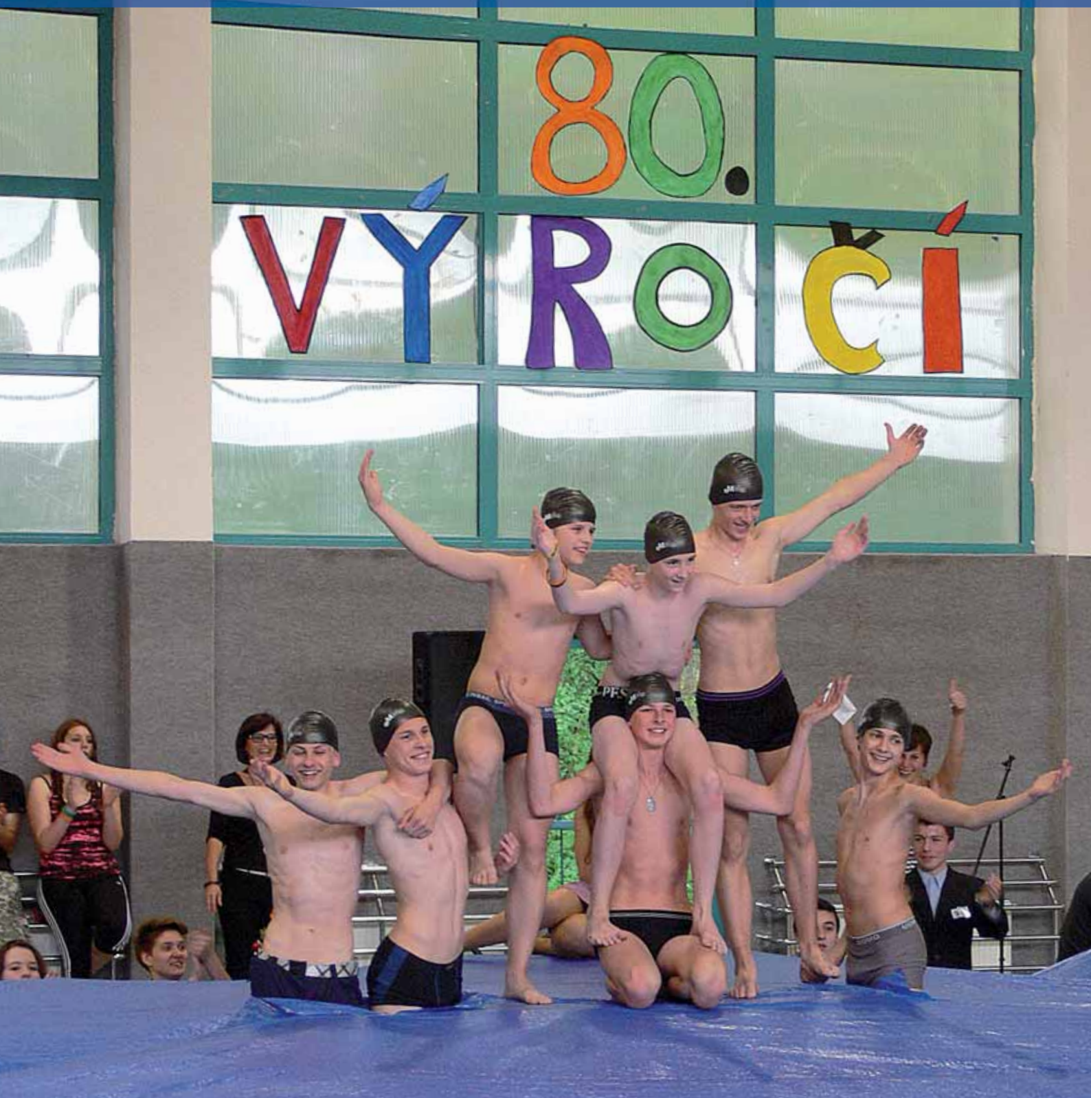
Základní škola U Obory – oslavy 80. výročí založení školy