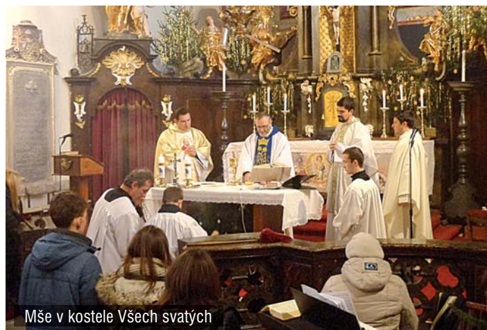
Mše v kostele Věch svatých

Bylo velmi povzbudivé vidět, jak mladí lidé různých národností hovořící různými jazyky přijeli k nám ne proto, aby debatovali. Zavítali k nám, aby se spolu s námi modlili, i když je dělí nejen jazyková, ale mnohdy i náboženská bariéra. Společně jsme hledali ne to, co nás rozděluje, ale naopak to, co nás všechny zúčastněné spojuje. Tím spojníkem pro nás je Ježíš Kristus. Bylo to dobře vidět při každodenní ranní společné modlitbě ať už dvakrát v našem kostele Věch svatých nebo jednou v Husově modlitebně Českobratrské církve evangelické. Naše společná víra v Syna Božího byla nejintenzivněji cítit při bohoslužbě o slavnosti Panny Marie na Nový rok. Kromě češtiny tu zazněla polština, běloruština, němčina, angličtina, italština a španělština. Mohli jsme tu vnímat universalitu církve, kdy se v jednom kostele při bohoslužbě setkali lidé z celé Evropy a různých křesťanských vyznání. Doufám, že jsme si všichni uvědomili to, co nás opravdu sjednocuje.