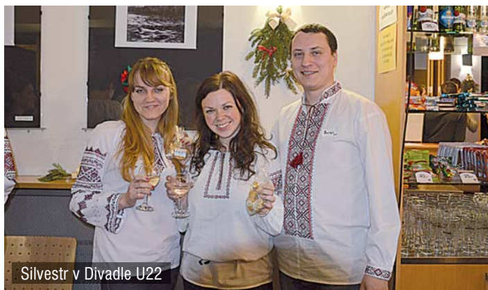
Silvestr v Divadle U22

Na přelomu let 2014/2015 se v Praze již podruhé (poprvé to bylo na přelomu let 1990/1991) uskutečnilo evropské setkání mládeže Taizé, na které dorazilo přes 30 000 mladých účastníků. Jak jste si mohli přečíst již ve Zpravodaji z prosince 2014, do pomoci se zapojili i občané z Uhřetěvesi a okolí.