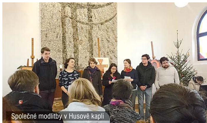
Společné modlitby v Husově kapli