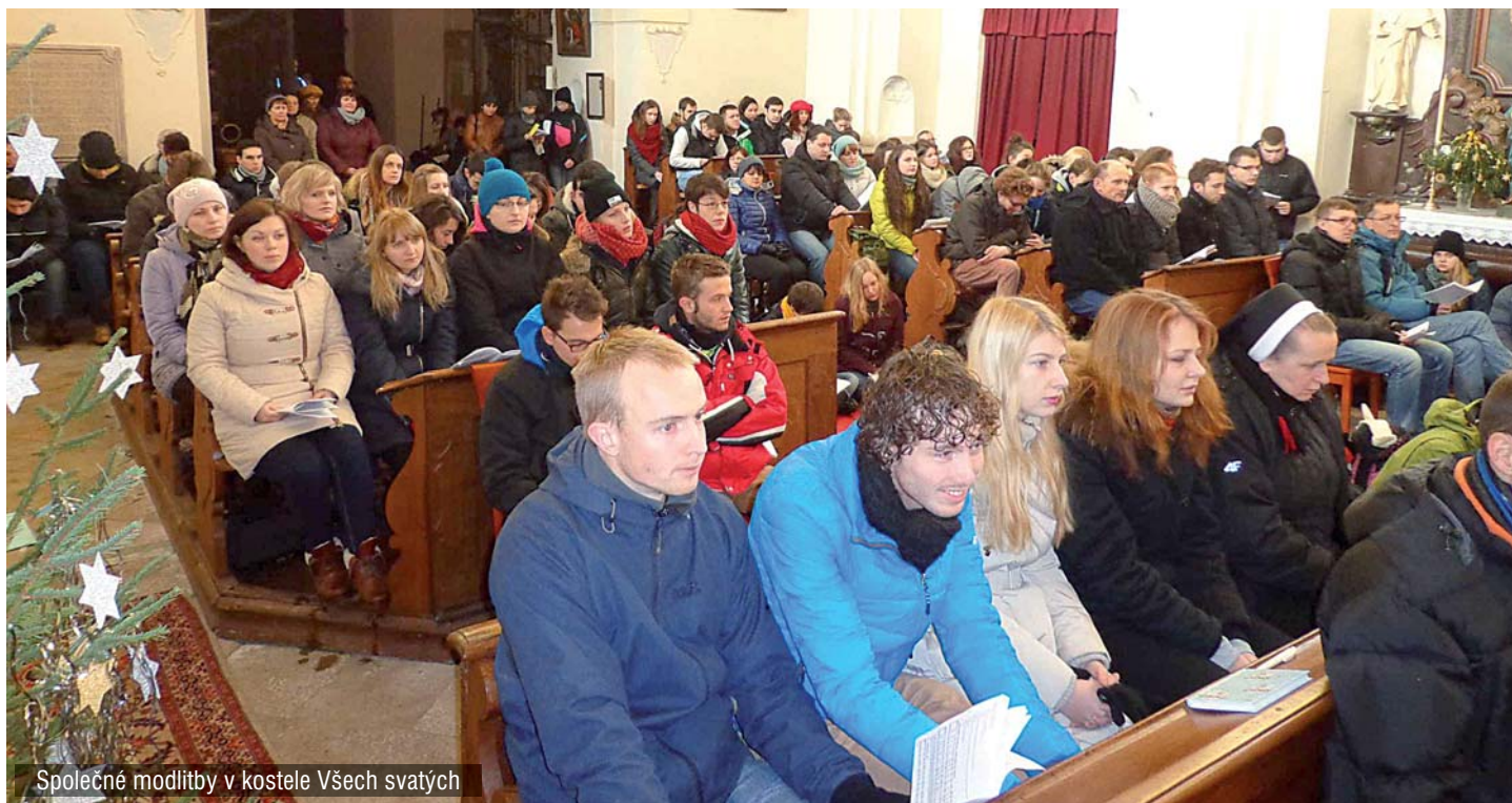
Společné modlitby v kostele Všech svatých