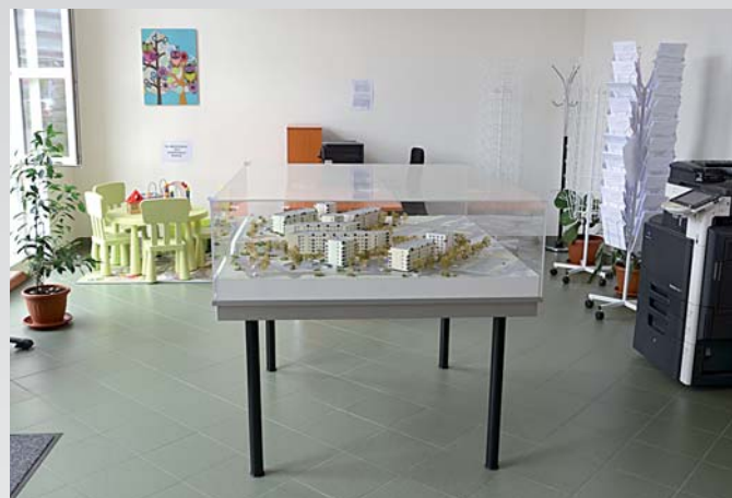
OIC – prezentační model výstavby 1. a 2. etapy souboru Vivus

Rezervaci pro poradenství si můžete objednat na telefonu: 271 071 812