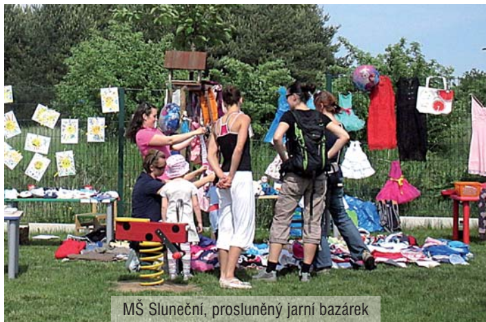
MŠ Sluneční, prosluněný jarní bazárek