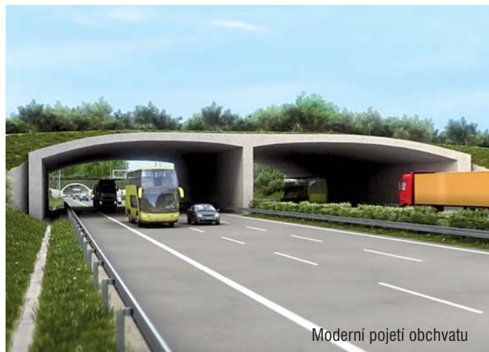
Moderní pojetí obchvatu