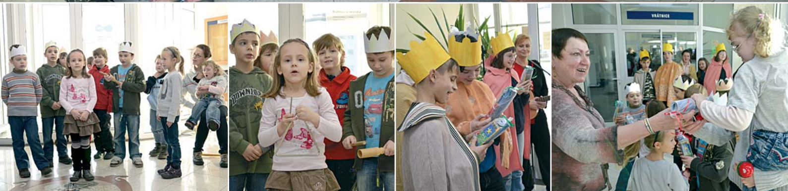
Každoroční tříkrálové zpívání na radnici.