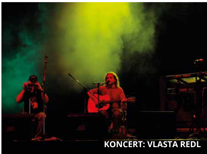
KONCERT: VLASTA REDL