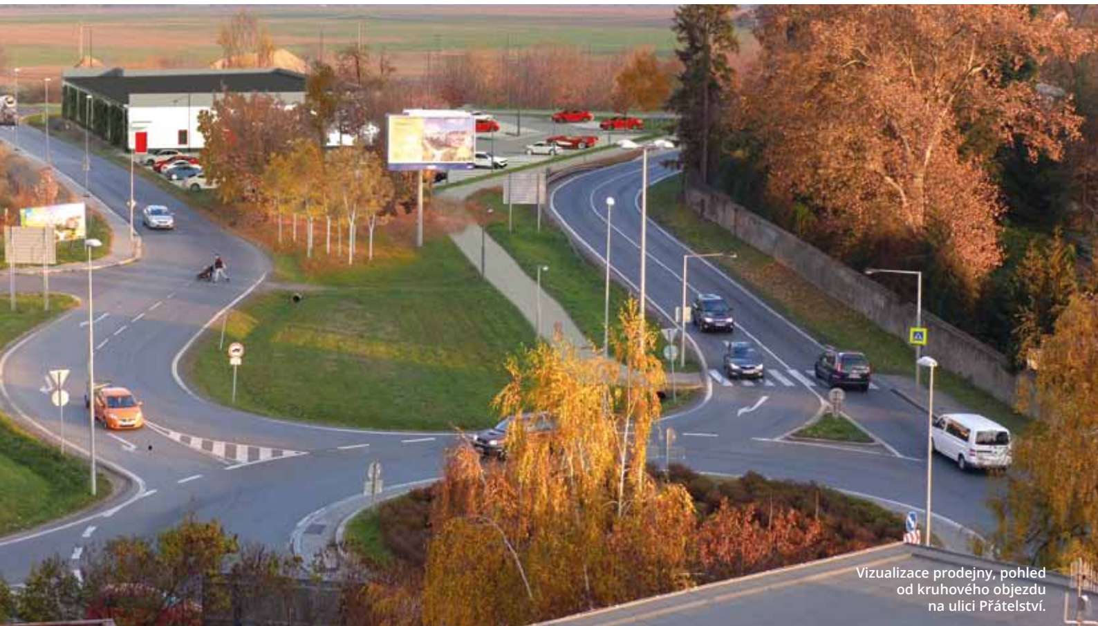
Vizualizace prodejny, pohled od kruhového objezdu na ulici Přátelství.