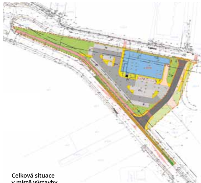
Celková situace v místě výstavby.

PRODEJNA BUDE stát mezi ulicemi Přátelství a K Uhříněvsi nedaleko kruhového objezdu na Říčany na místě stávajícího sadu. Výstava by měla být zahájena na přelomu tohoto roku. U obchodu bude vybudováno parkoviště a v budoucnu i zastávka autobusu. Přístup bude z obou přilehlých ulic. ■