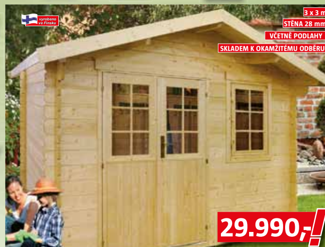
Zahradní domek BAUHAUS vnější rozměr domku vč. přesahu střechy 3,5 x 3,66 m, výška hřebene střechy 250 cm, výška boční stěny 200 cm, materiál severský smrk, včetně kompletního spojovacího materiálu a kování, praktické dvojité dveře s kovovým prahem