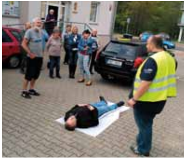
ODBOR SOCIÁLNÍCH VĚCÍ A ZDRAVOTNICTVÍ