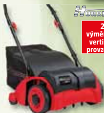
2 v 1: výměnné válce vertikutátor/ provzdušňovač