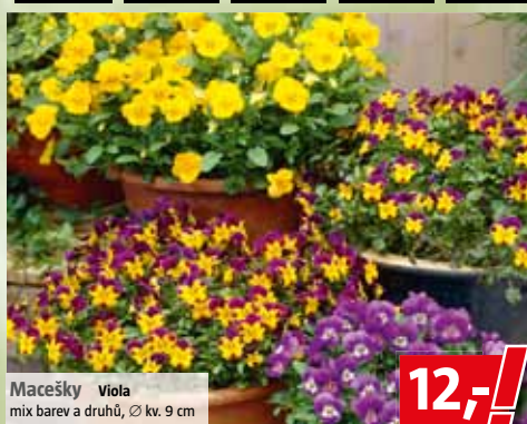
Macešky Viola mix barev a druhů, Ø kv. 9 cm

k. z. Průhonice – Čestlice NEJŠIRŠÍ VÝBĚR ZA NEJLEPŠÍ CENY!