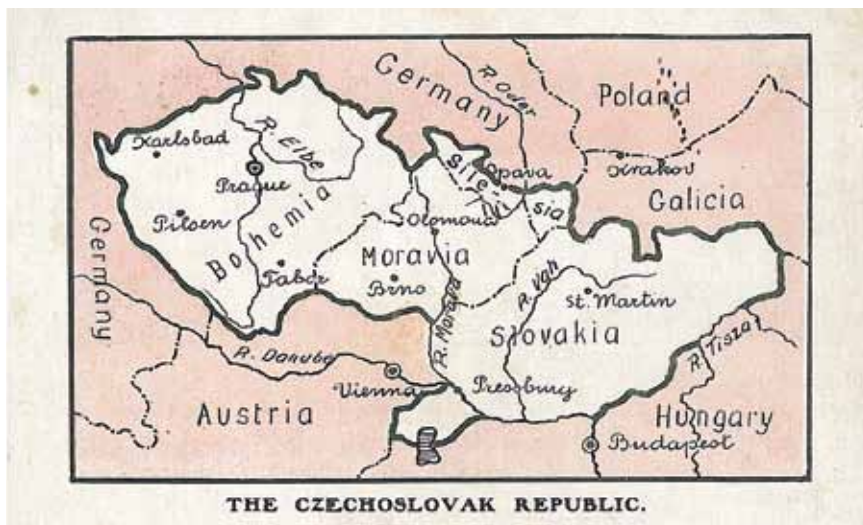
Návrh československého státu z roku 1918