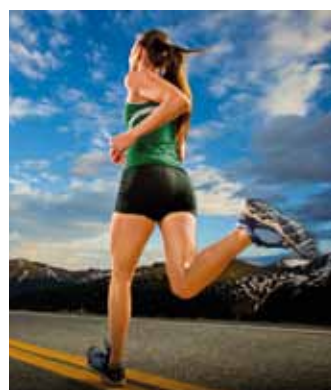
Běhání 5. díl - jak zrychlit?