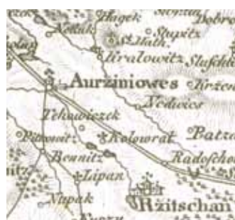
Uhříněves na Kreibichově mapě