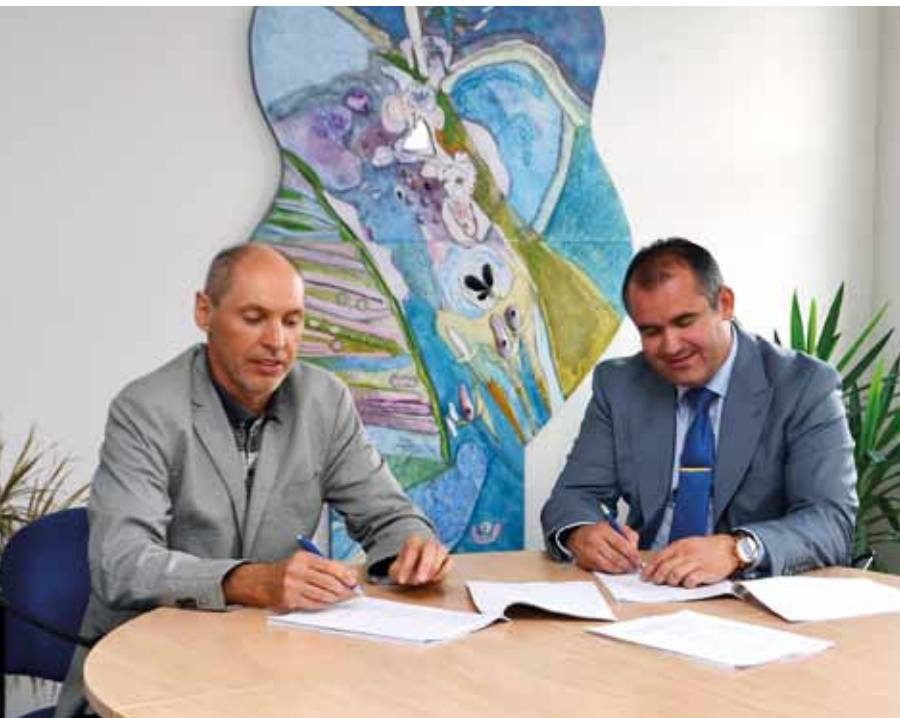
K podpisu smlouvy došlo v zasedací místnosti radnice Půdorys pediatrické ordinace Současný stav stavby (říjen 2016)