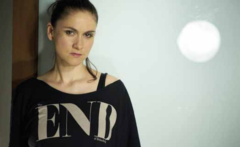
LENKA DUSILOVÁ & BAROMANTIKA – STŘEDA 9. 11. V 19:30