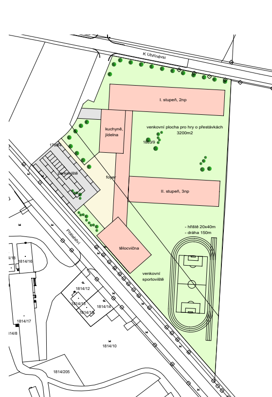
Možná poloha školy mezi ulicemi Přátelství a K Uhříněvsi