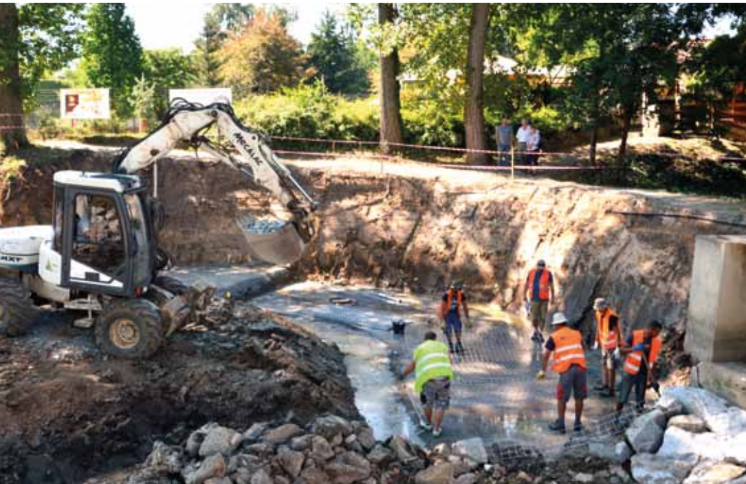
V Malé Vodici vzniklo nové jílovité dno s patřičným spádem

VZHLEDEM K ROZSÁHLÝM OPRAVÁM PROBĚHNE V NÁSLEDUJÍCÍCH TÝDNECH PRO ZÁJEMCE KOMENTOVANÁ PROCHÁZKA KOLEM RYBNÍKŮ S RADNÍM PRO VÝSTAVBU A INVESTICE PETREM SEMENIUKEM. TERMÍN BUDE UPŘESNĚN NA WEBU MČ A VE ZPRAVODAJI