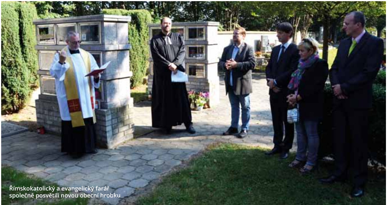
Římskokatolický a evangelický farář společně posvětili novou obecní hrobku