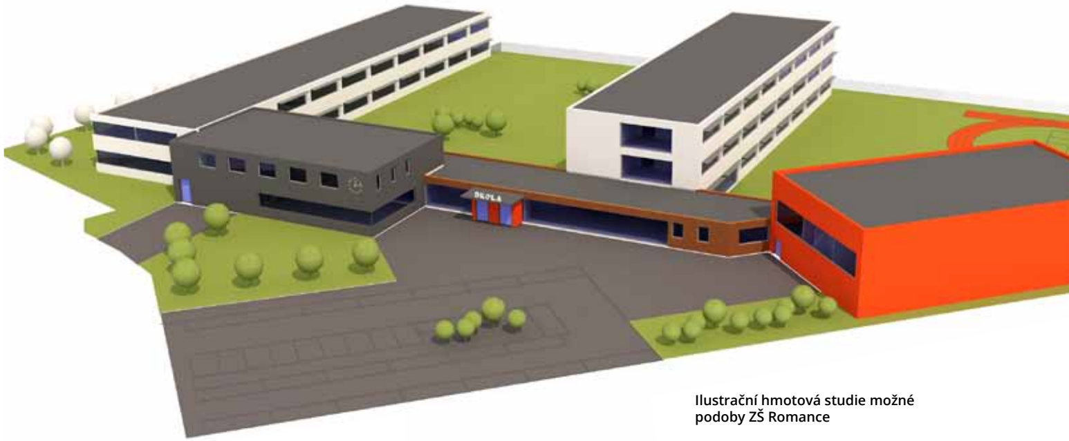
Ilustrační hmotová studie možné podoby ZŠ Romance