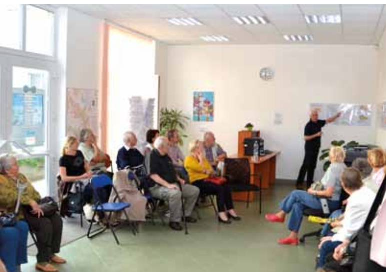
Přednáška přiblížila vývoj československých a českých hranic