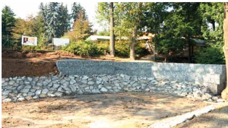
Gabionová stěna je vysoká čtyři metry a slouží jako opěrný svah pro cyklostezku