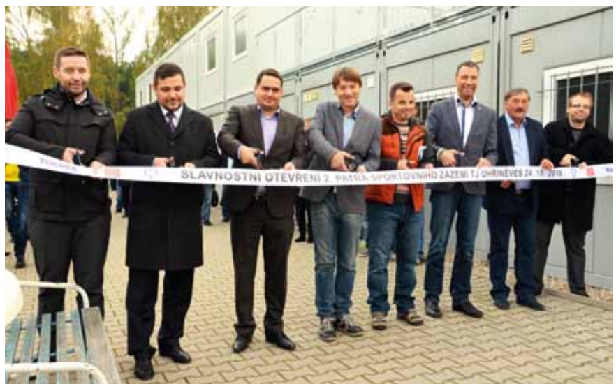
Páska se stříhla u rozšířeného zázemí pro sportovce