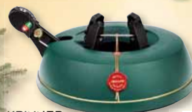
KRINNER Stojan na vánoční stromek Basic S pro výšku stromku až 180 cm a Ø kmene až 9 cm, nádrž na vodu 11, 5 let záruka, patentovaný mechanismus pro rychlé a snadné uchytcení stromku