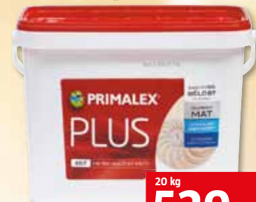
26 90 /kg Primalex Plus 20 kg

bílá barva, dobrá kryvost a vydatnost, otěruvzdorná, paropropustná, bělost min. 86 %