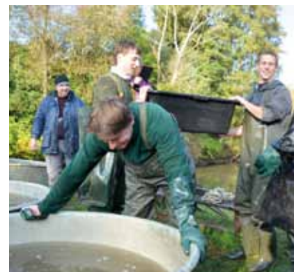
Pasování starosty do rybářského cechu

Vznik: zřejmě v 16. století – součást soustavy rybníků na Říčanském potoce