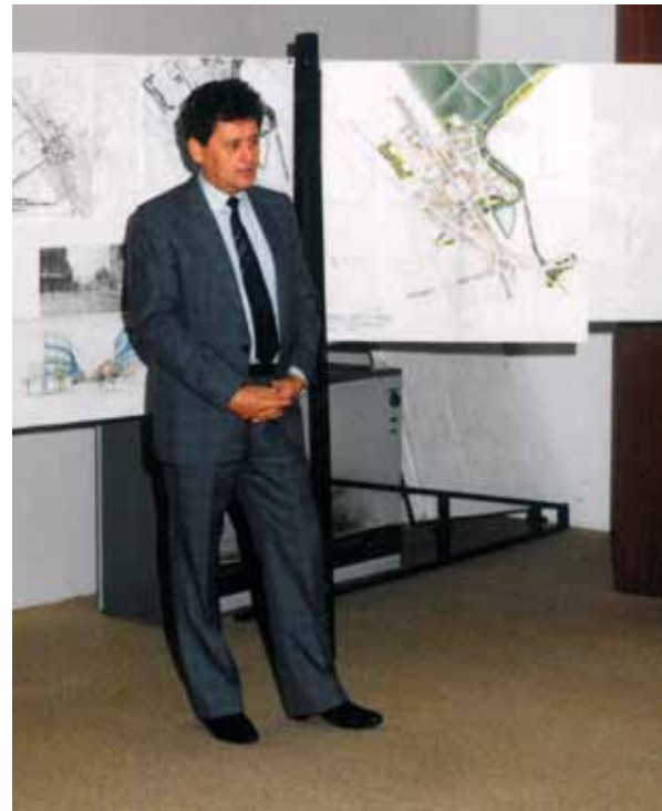
▲ Veřejná prezentace záměru rozvoje naší městské části v Legionářském domě