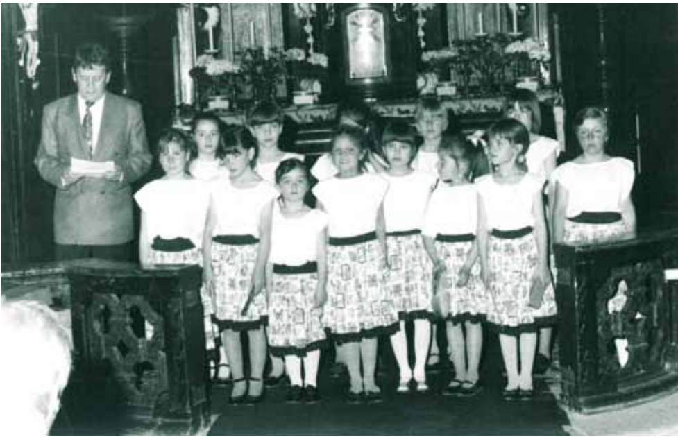
◀ Projev při slavnostním koncertu Dětského pěveckého sboru Jiskřička při ZŠ nám. Brří Jandusů v děkanském kostele Všech svatých