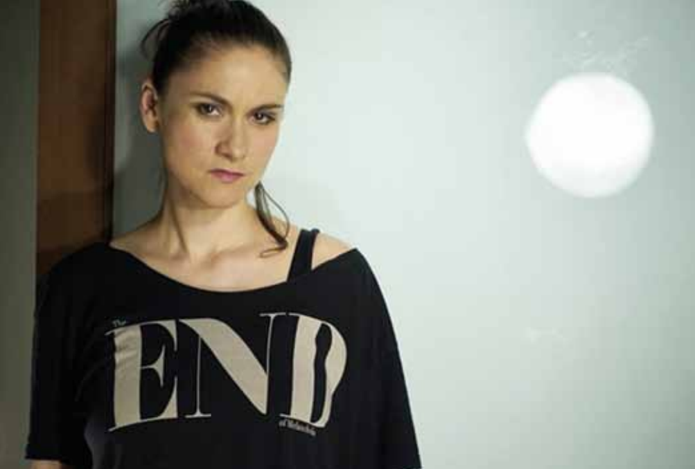
LENKA DUSILOVÁ & BAROMANTIKA – středa 1. 2. v 19:30