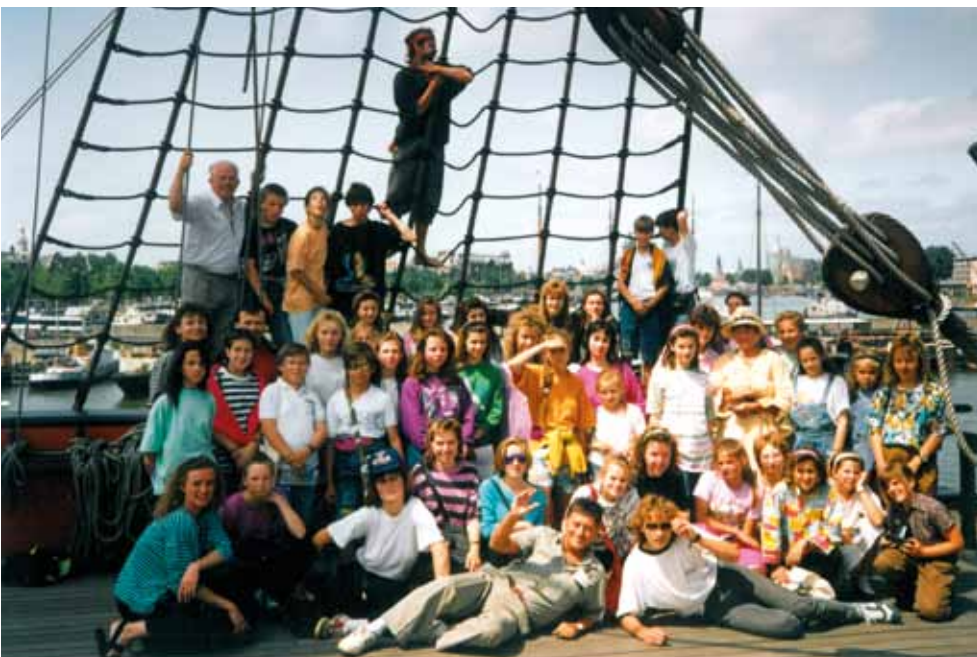
◀ Dětský pěvecký sbor Jiskřička, chlouba naší městské části, vyjžděl i do zahraničí - např. do holandského Zellhemu