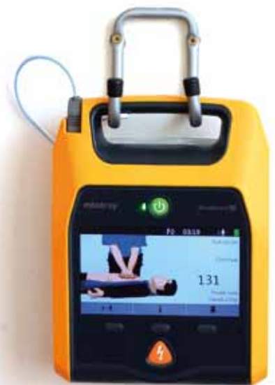
Malý kufřík, který vám zachráni život