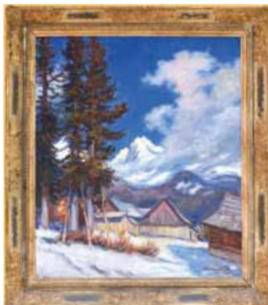
▲ Gerlachovka z Vyšných Hágů