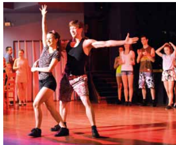
▲ Předtančení TSK Silueta