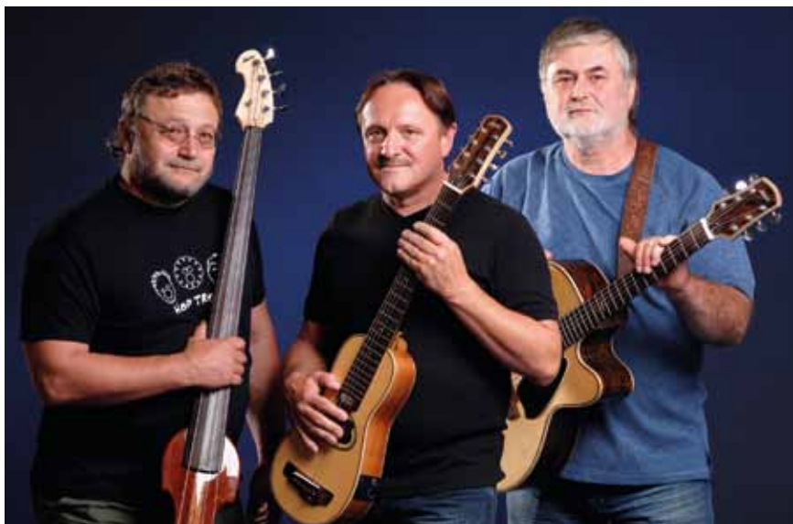
HOP TROP – středa 26. dubna 2017 v 19:30