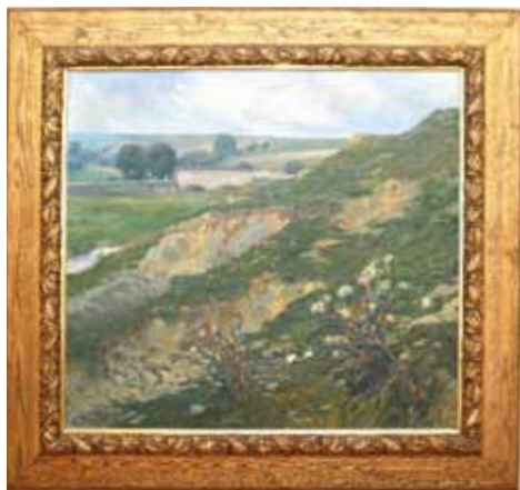
▲ Mostek na Pitkovickém potoce z Benických skalek