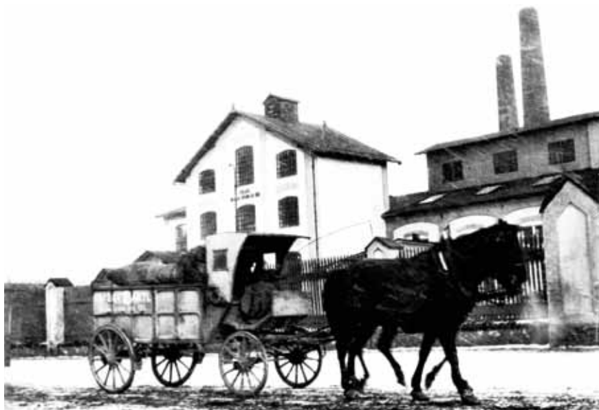
Doprava cukrové řepy do cukrovaru (1910)