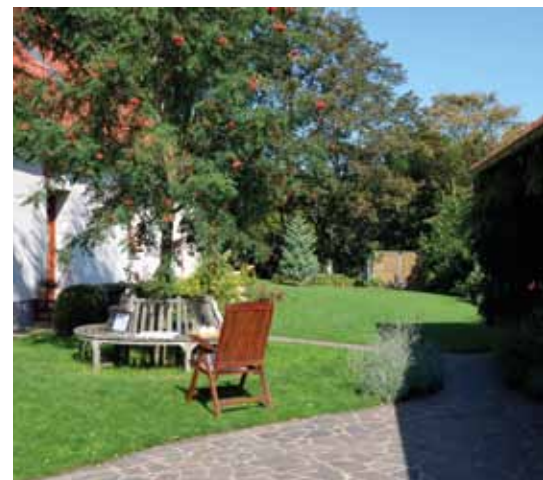
U jedlé jeřabiny na kruhové lavičce probíhal rozhovor.

Mimochodem – VÚŽV bychom rádi poděkovali za vstřícný postoj po celou dobu rekonstrukce, kdy nám např. umožnili průjezd aut skrz jejich areál.