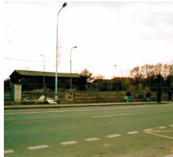
Takhle nevhledně vypadala lokalita dnešního Nového náměstí. Pohled k ulici Ke Kříži. Foto je z roku 2001.