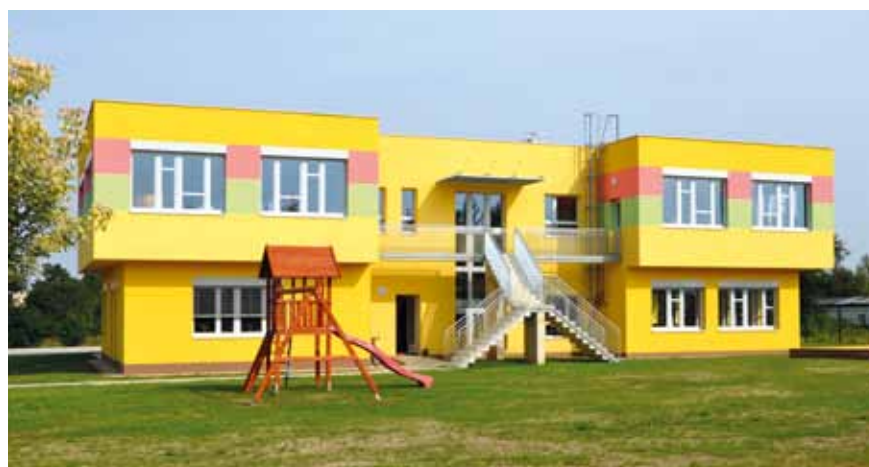
Provoz MŠ Sluneční byl zahájen 2. září 2013.

Další díl ze seriálu o historii bude o čestných měšťanech a čestných občanech Uhříněvsi.