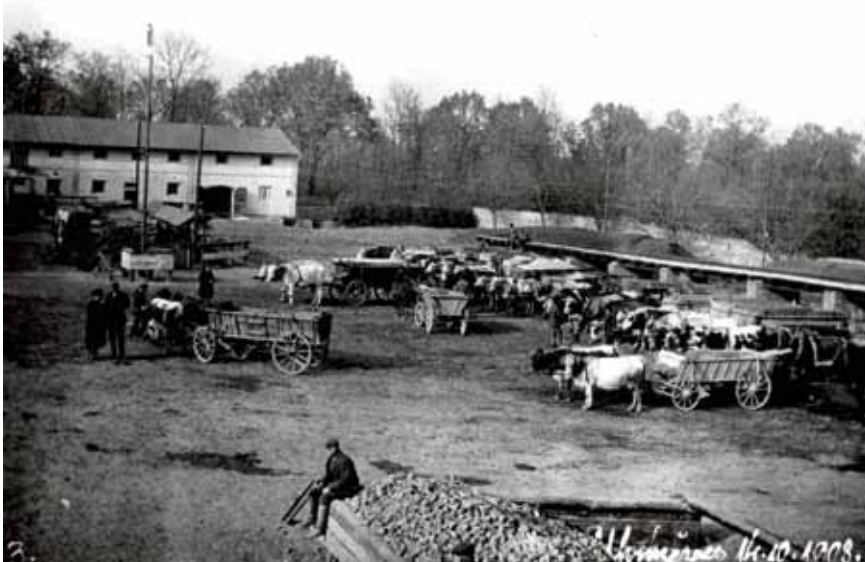
Cukrovarské voľské povozy na nádvoří, v pozadí budova stájí, dnešní Uhřetěveské muzeum (1908)