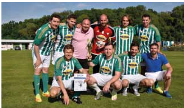
Druhý ročník turnaje Prahy 22 ve fotbalu – vítězný tým Bohemians Praha 1905.