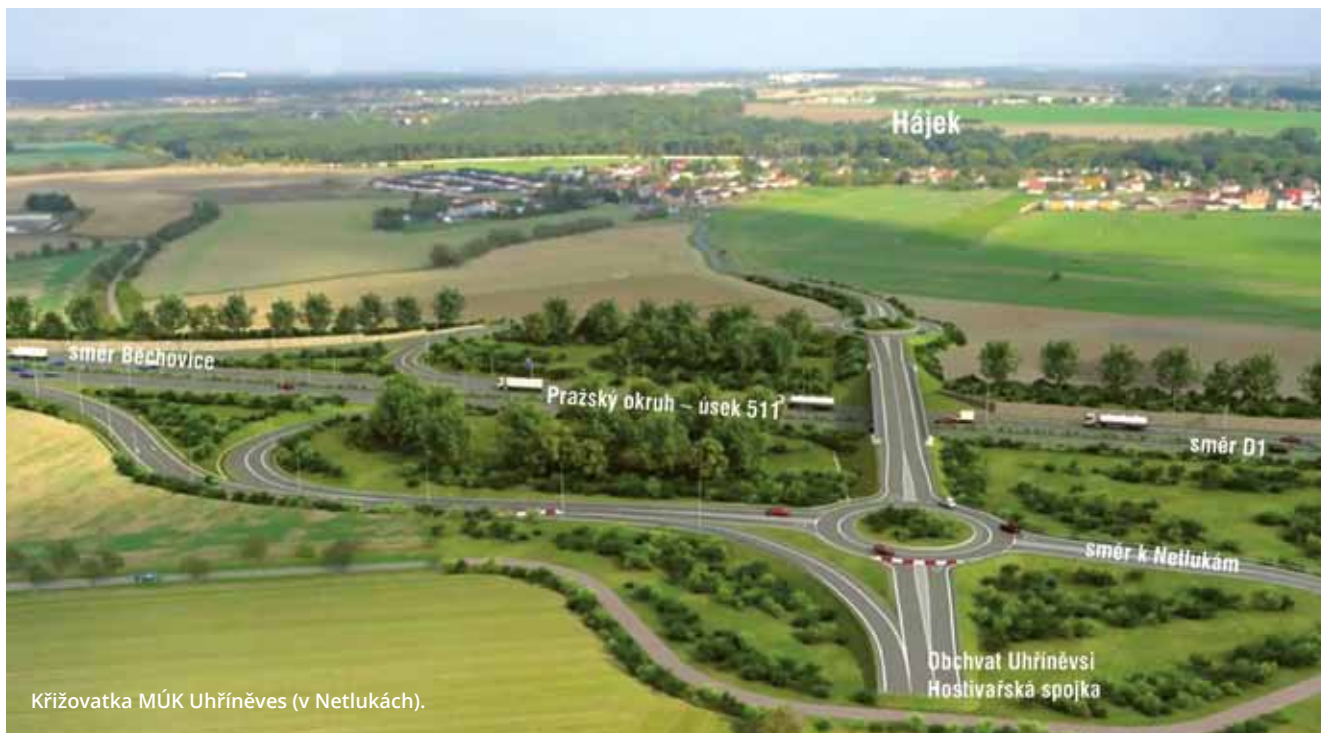
Křižovatka MÚK Uhřetín (v Netlukách).