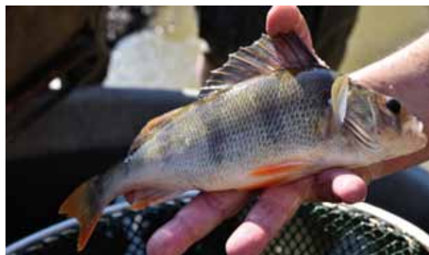
Zástupce dalších druhů ryb – okoun.