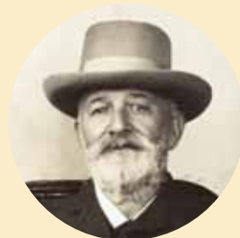
Alois Tichý (1837–1916)

do Pivovarské restaurace na oslavu 2. narozenin znovuotevření našeho pivovaru a svátku Aloise, sládků, po kterém naše pivo hrdě nese své jméno.