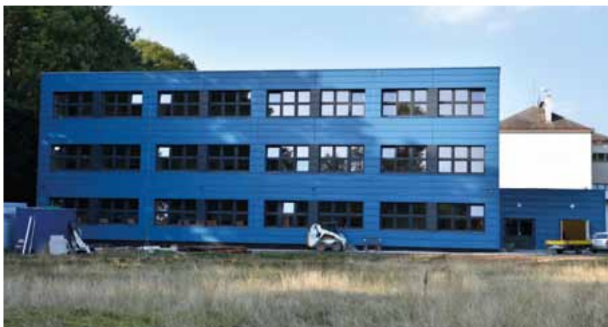
Nový pavilon ZŠ U Obory (9/2018), 9 + 1 třída, 300 dětí.

Poslední novinkou je, že Odbor výstavby našeho ÚMČ Praha 22 byl pověřen ministerstvem pro místní rozvoj k vydání územního rozhodnutí stavby 511, což je klíčový dokument, od kterého se vše další odvíjí. Ačkoliv se jedná o přísně oddělený výkon státní správy reprezentovaným naším Odborem výstavby, nutně musíme pomoci našemu úřadu po stránce