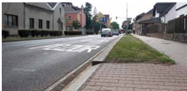
Možnost dosázení keřů okolo ulice Přátelství směrem na Nové náměstí