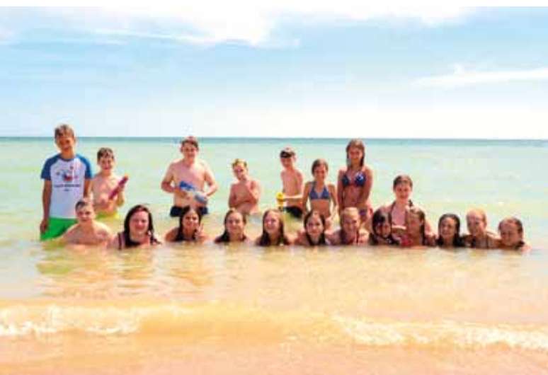
Koupání v moři.

Anežka Koubková, Kateřina Kadlecová, vyučující