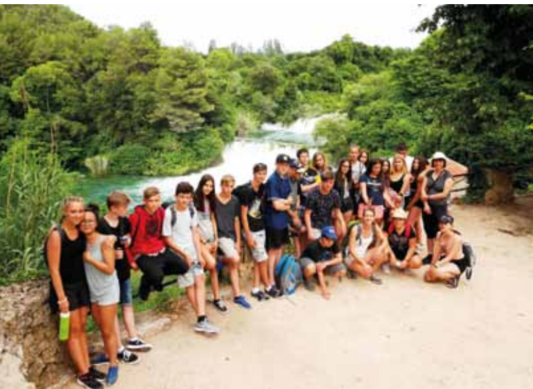
Národní park Krka.