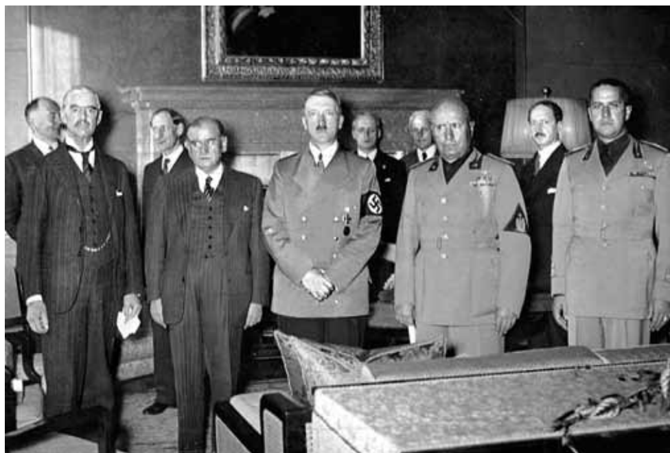
◀ Z průběhu jednání v Mnichově. Zleva: za Velkou Británii Neville Chamberlain, za Francii Édouard Daladier, za Německo Adolf Hitler a za Itálii Benito Mussolini.