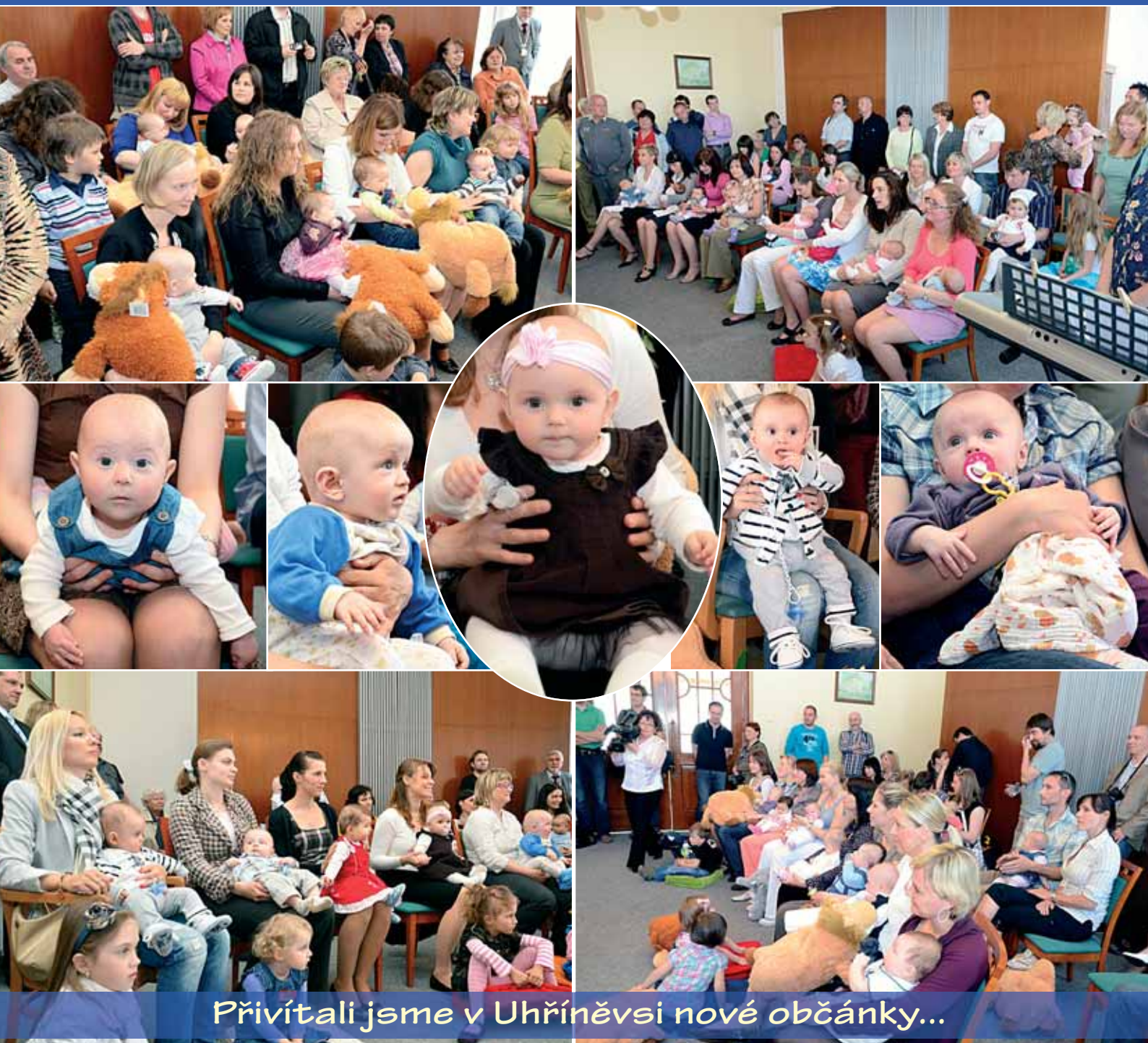
Přivítali jsme v Uhříněvsi nové občánky...