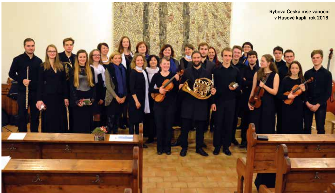
Rybova Česká mše vánoční v Husově kapli, rok 2018.