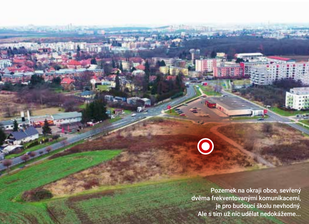
Pozemek na okraji obce, sevřený dvěma frekventovanými komunikacemi, je pro budoucí školu nevhodný. Ale s tím už nic udělat nedokážeme...

Kdy už bude konečně nová škola? Co se stalo s projektem? Děje se vůbec něco? To jsou otázky, které v posledních měsících rezonují v naší městské části. Následujících deset stran zpravodaje jsme se rozhodli věnovat tématu nové uhříněveské školy a detailně rozvést důvody, které nás vedly k žádosti si projekt převzít od Magistrátu hl. města Prahy a zásadním způsobem ho přepracovat.