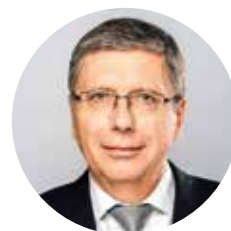
■ Ladislav Kos, senátor za volební obvod č. 19

Každé pondělí od 14 do 18 jsem pro Vás k dispozici v senátní kanceláři na Praze 11, Kosmická 746.