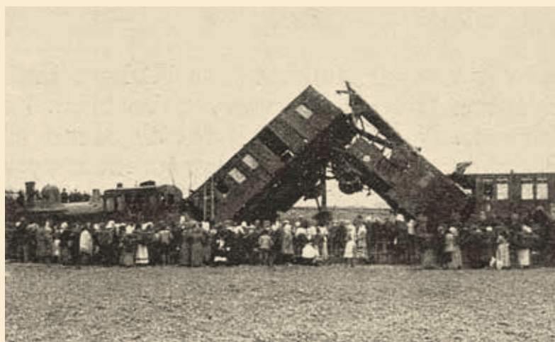
↑ Říčany 1916.