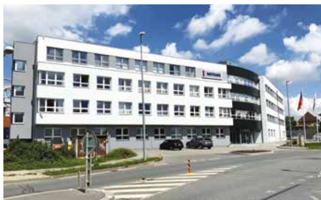
↑ Administrativní budova v ulici Podleská.

To jsou čísla za jeden den, o tolik kamionů méně potkáme na našich silnicích a úměrně méně je i zatěžováno naše životní prostředí.