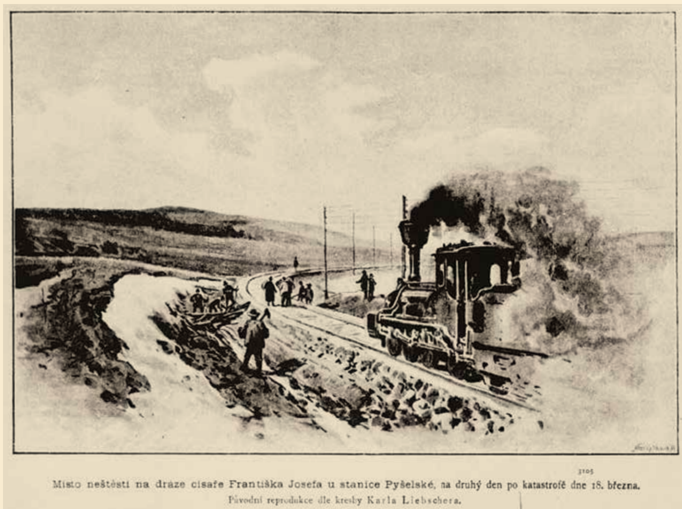
Místo neštěstí na dráze císaře Františka Josefa u stanice Pyšelské, na druhý den po katastrofě dne 18. března. Původní reprodukce dle kresby Karla Liebschera.