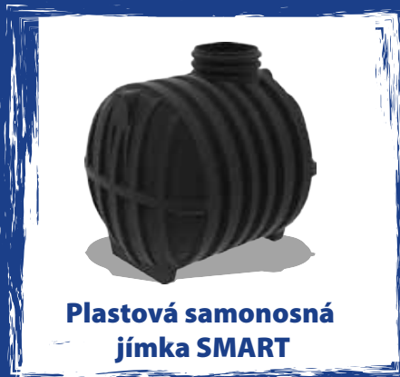
Plastová samonosná jímka SMART