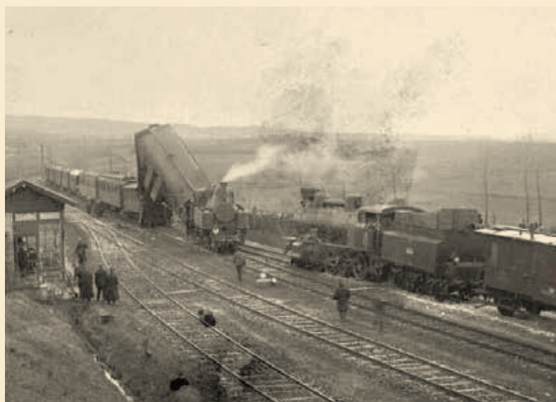
↑ Říčany 1916.