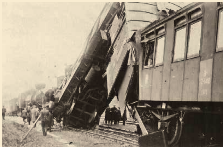
↑ Říčany 1916.

Koncem září roku 1947, v roce, kdy se země potýkala s velkým suchem, začala výluka koleje mezi stanicemi Senohraby a Čerčany. Na celý říjen byla naplánována výměna pražců s úpravou podloží.