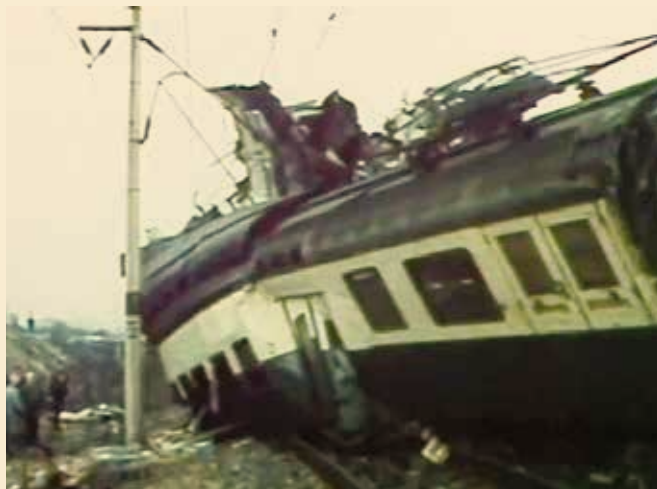
↑ Hostivař 1988.

Druhá nejhorší pražská železniční nehoda, která stále zůstává ve vzpomínkách uhříněveských starousedlíků, se stala poslední březnový den roku 1988. Ve stanici Praha-Hostivař probíhaly v březnu výlukové práce, při kterých bylo mimo provoz i zabezpečovací zařízení stanice. Před pátou hodinou ranní odjel z Uhříněvsi nákladní vlak, který měl z Hostivaře pokračovat po trati do Malešic. Výpravčí stanice Hostivař dala výhybkářům pokyn pro postavení vlakové cesty do Malešic. Výhybkář na vršovicko-malešické straně nádraží postavil omylem vlakovou cestu do Vršovic, místo do Malešic. Při následném vyšetřování do protokolu uvedl, že výpravčí rozuměl, že vlak pojedou do Vršovic. V 5:11 hodin projel nákladní vlak stanici Hostivař a zamířil na trať do Vršovic. Když strojvedoucí nákladního vlaku zjistil, že jede po jiné trati, zastavil vlak u drážního domku na odbočce Záběhllice (kousek od nově vznikající stanice Zahradní Město) a šel se tamního zaměstnance zeptat, proč odjel nesprávným směrem.