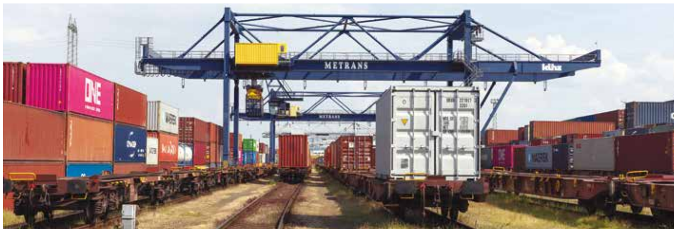
↑ Metrans disponuje flotilou více než 3000 vagonů.