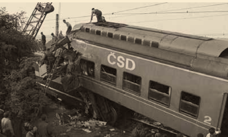
↑ Hloubětín 1965.

Patrně nejhorší železniční nehoda na území Prahy se stala 21. září 1965 na kolínské trati. Osobní vlak do Kolína zastavil pro výstup a nástup cestujících v zastávce Hloubětín. Ta se nacházela na konci dnešní ulice U Elektry (při odklonech přes Malešice vlaky přes toto místo jezdí). Za ním jel od Libně nákladní vlak, který projel oddílové návěstidlo v poloze Stůj. Náraz nákladního vlaku do pantografové jednotky byl tak silný, že se obě soupravy zastavily až o osmdesát metrů dále. Z troskek vlaků bylo vyproštěno třináct mrtvých a dalších 66 cestujících bylo zraněno.