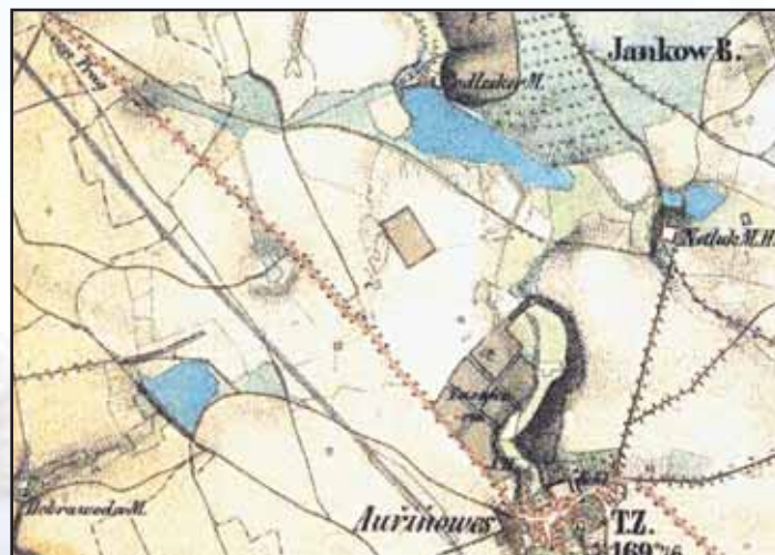
Podleský rybník a rybník Malé jezero, komunikace Přátelství a náskres trasy železnice