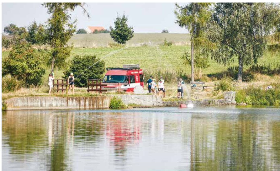
V létě jsem měl možnost navštívit několik příměstských táborů. A všude to bylo stejné – nadšené děti a spokojení vedoucí. (Foto z farního tábora s hasiči u Velké Vodice.)

Den s hasiči na farním táboře u Velké Vodice.