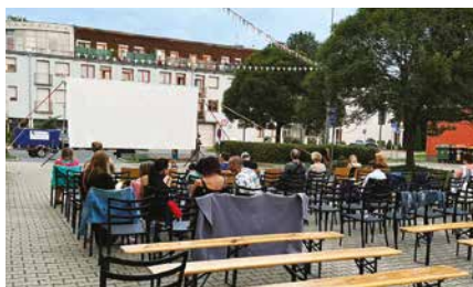
Letní kino před muzeem přilákalo při hezkém počasí mnoho diváků.

Není ale možné, aby se náklady na údržbu jejich bytů přenášely zcela na městskou část. Průměr tržního nájemného se v Praze pohybuje kolem 350 Kč/m 2 , regulovaný