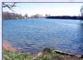
Podléský rybník dnes

V obecném povědomí je obor rybníkářství spojen zejména s třeboňskou a budějovickou krajinou, s rody Rožmberků a Schwarzenbergů a jmény slavných stavitelů rybníků Štěpánka Netolického, Jakuba Krčina a Mikuláše Rutharda. Za období největšího rozmachu rybníkářství se považuje 15. a 16. století, kdy rybníky byly zakládány na všech příhodných místech. Jejich zřizovatelem byla šlechta, města i církev. Tricetiletá válka přinesla velké změny do krajiny, zmizela řada vesnic, dvorů i rybníků, krajina se vylidnila. K dalšímu úpadku rybníkářství docházelo v 17. a 18. století, kdy vlivem josefínských reforem byly zejména mělké rybníky hromadně rušeny orbou a stávají se z nich úrodná pole pro pěstování pšenice. Odhaduje se, že v 16. století bylo u nás cca 180 000 ha vodních ploch rybníků, v současnosti se jedná o 24 000 rybníků o ploše 52 000 ha.