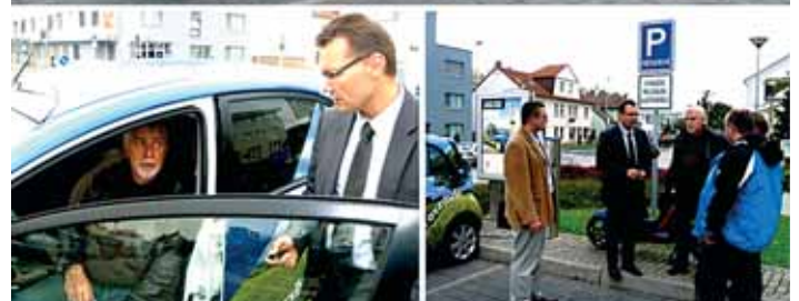
V pondělí 1. 10. byla v rohu Nového náměstí slavnostně zprovozněna veřejná nabíjecí stanice pro elektrovozidla, tzv. E-point...