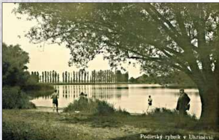
Pohlednice Podleského rybníka z roku 1935

Podleský rybník (dříve Podlesek) je jediný zachovalý ze soustavy velkých rybníků, napájený pravou větví Říčanky po jejím průtoku Oborou, je to druhý největší pražský rybník o ploše 12 ha. Na jeho hrázi roste osm starých dubů s odhadem stáří 250 let, hráz je dlouhá 200 m, vysoká 5 m. Hráz se nachází již na katastru Dubče. Za hrázi jsou zbytky Podleského mlýna asi ze 16. století. U rybníka najdeme největší pražskou chovnou stanicí jelenů a daňků. Zajímavá je pověst, že rybník vystavěli rovněž v 16. století turečtí zajatci a zalesněný pahorek Jankov u rybníka s třešňovkou vznikl z hlíny vnošené Turky [1]. Název „Podleský“ je odvozen od rozsáhlého a dnes již zmizelého lesa na severním okraji rybníka. Na Klauserově Uhříněvsi jeho podrobný záznam není.