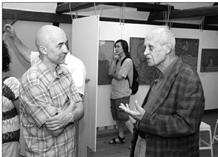
Foto z vernisáže ...