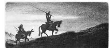
Autor grafiky: Pavel Šimon

Chcete jej vidět? Pak vás zveme od 10. února do 10. dubna do Muzea Říčany, kde bude probíhat výstava grafik s námětem nesmrtelného románu Miguela de Cervantes. Budete si moci prohlédnout výtvarná díla českých a slovenských umělců, která pocházejí ze sbírek říčanských sběratelů. Výstava bude doplněna expositivními plakáty k filmovému zpracováním Dona Quijota, které zapůjčil Instituto Cervantes Praha.