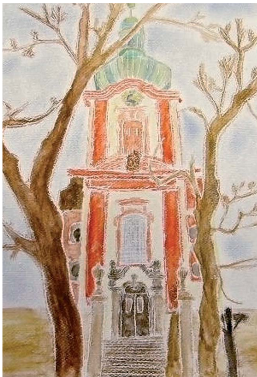
Kateřina Soumarová - Kostel Věch svatých v Uhříněvsi, 2. místo ve výtvarné soutěži „Moje Uhříněves“