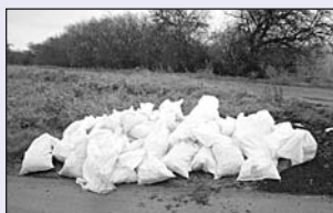
Bečovská: inertní odpady...