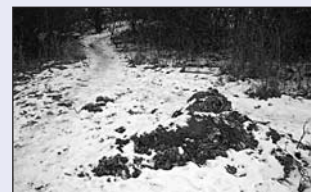
Podléský rybník: biologické odpady...