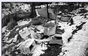
Odbočka z Bečovské: komunální odpady...