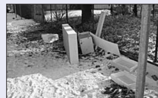
Ulice Semanského: torza nábytku...