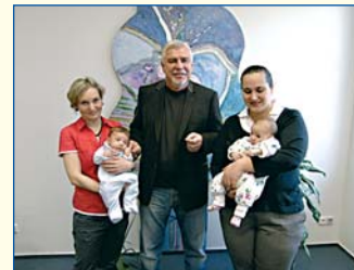
Starosta a šťastné maminky...