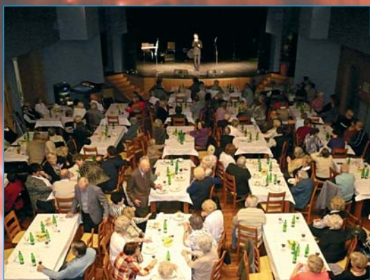
Pohled z balkonu