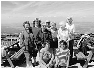
Po výstupu na Sněžku

V neděli jsme měly časný budíček a šly jsme Kamenkou do Vrchlabí. Z Vrchlabí nám jel autobus do Pece pod Sněžkou, dále jsme pokračovaly vláčkem k lanovce na Růžovou horu, kde jsme zlehka poobědvaly. Poté jsme vystoupaly na Sněžku. Výstupu se zúčastnilo 9 seniorek. Byly jsme hrdé na to, že jsme výstup všechny zvládly. Nahoře jsme se odměnily kávou a osvěžily vodou. Celý výstup nám trval 2 hodiny. Většina odhlasovala, že do chaty se vrátíme přes Luční boudu. Jak bylo odhlasováno, šly jsme přes Luční boudu,