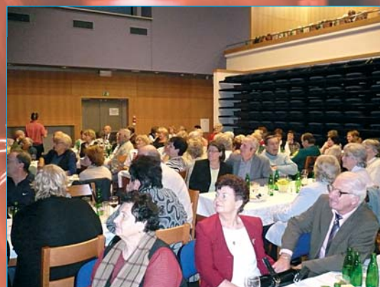
Tváře spokojených účastníků