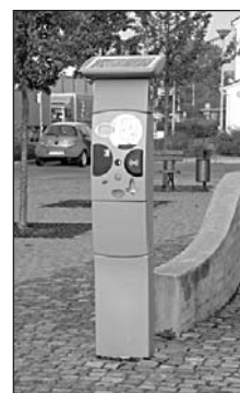
Jan KAVALEC, DiS. Zástupce ředitele OŘ MP 15

Rádi bychom znovu upozornili občany naší a přilehlých městských částí, že nám již na Novém náměstí fungují „oranžové“ zóny placeného stání (parkovací hodiny). Provoz je upraven na všední dny (PO – PÁ 08:00 hod. – 17:00 hod). Určitě je v zájmu každého z nás, abychom zaplatili minimální částku parkovného (5,- Kč za 50 minut). V opačném případě totiž hrozí postih za spáchaný přestupek udělením pokuty až do výše 2000,-Kč. Určitě nemusím zdůrazňovat naprosto jasný nepoměr zaplacené částky vůči možné udělené pokutě, i když se v naprosté většině případů samozřejmě maximální částka neudělí.