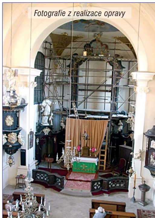
Fotografie z realizace opravy

Žijeme v městské části, která za posledních 15 let výrazně změnila svou tvář. Přibýlo velké množství trvale bydlících obyvatel, vzniklo Nové náměstí, kde je mnoho obchodů a služeb. Vznikla nová dětská hřiště, pomalu se vysazuje i doplňuje zeleň na místech, kde chyběla nejvíce. Co je ale velmi důležité, je skutečnost, že se opravují i historické budovy, které dávají naší