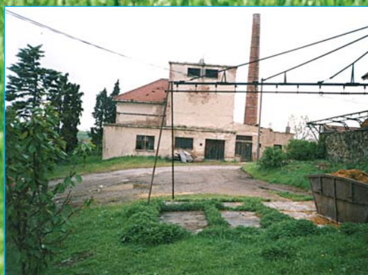
Rok 2005 před opravou