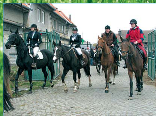
Tradiční Hubertova jízda, farma Netluky