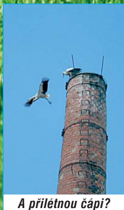
A přilétnou čápi?