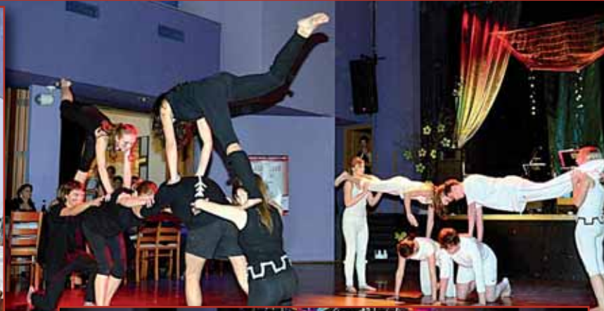
... v Divadle Bolka Polívky U22 - více na str. 9 a 12