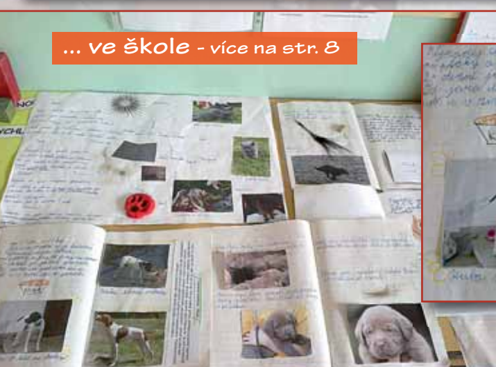
... ve škole - více na str. 8