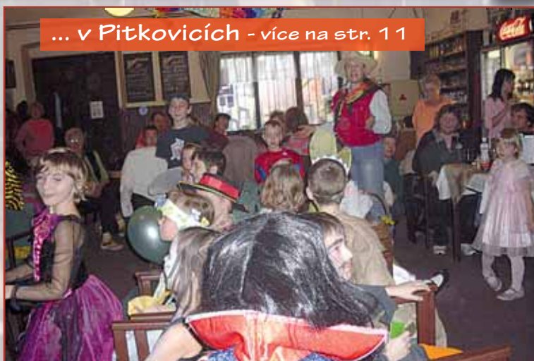
... v Pitkovicích - více na str. 11