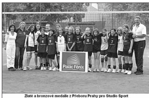
Zlaté a bronzové medaile z Přeboru Prahy pro Studio Sport