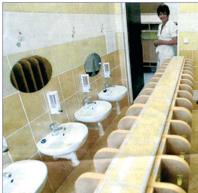
ZISKALI 28 MÍST. Děti z Uhřetěvesi, Královic, Nedvězí i z Hájků budou moci od 1. září chodit do nové školky v Královicích. Ta vznikla po přestavbě zdejší základní školy.