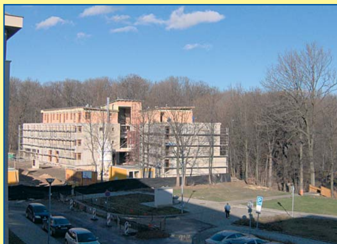
Uhříněves – Dům s pečovatelskou službou II