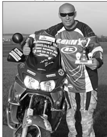
Čtvrtý titul mistra republiky ve sportovní mototuristice jsem vybojoval právě díky dlouhodobému testu Hondy Varadero.

O tom už jsem něco slyšel. Když jste zde měl výstavu, kde mohli návštěvníci obdivovat vaše „stotisícové“ motocykly, bylo zde i množství pohárů a také mistrovské tituly za tuto disciplínu.