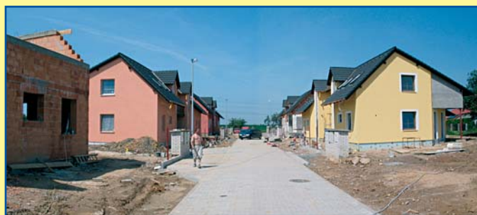
Hájek – výstavba rodinných domů World House s.r.o.