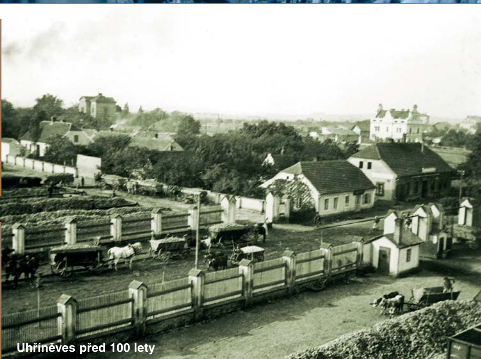
Uhřetěves před 100 lety