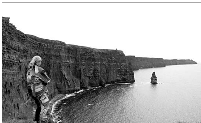
Krásy Irsko nám vzaly dech. Moherské útesy stoupají z Atlantického oceánu do výšky téměř 300 m