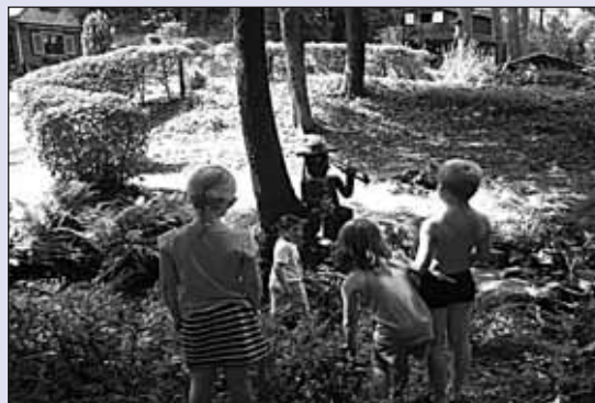
Příměstský letní tábor 2013