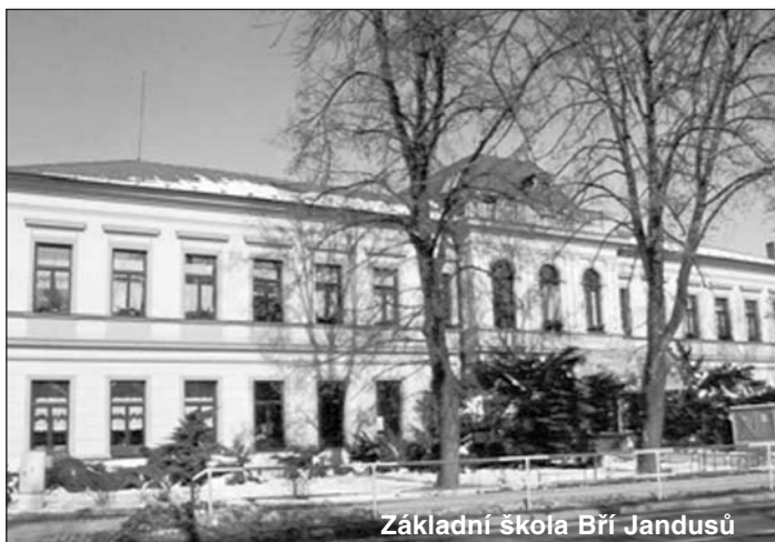
Základní škola Bří Jandusů

V příštím čísle: Práva a povinnosti žáků. Práva a povinnosti zákonných zástupců nezletilých žáků