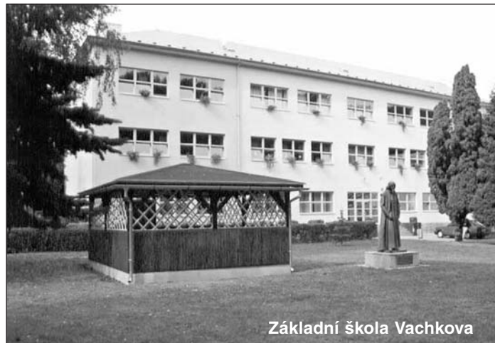
Základní škola Vachkova