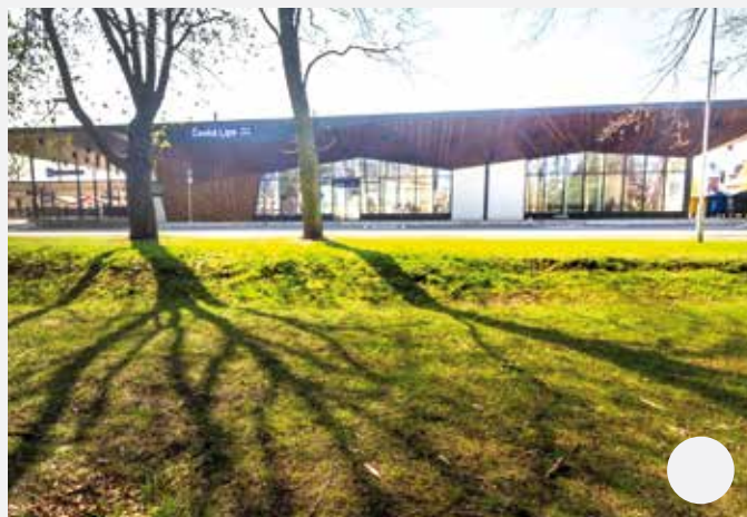
Nová moderní podoba nádraží, přístup z parku/vegetačního pásu.