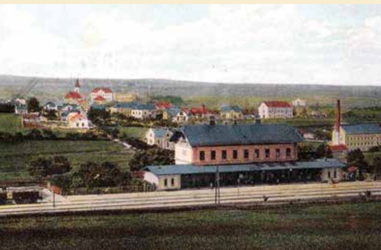
↑ Říčany, kolem roku 1910.