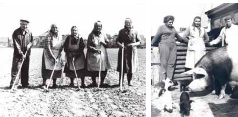
Uhříněves stála od počátku v centru aktivit zvelebování zemědělství, zejména v chovu hospodářských zvířat.

Výzkumný ústav živočišné výroby, v. v. i. (VÚŽV), je kromě bohaté vědecké činnosti i nositelem historického kulturního dědictví našich předků díky areálu zámku, ve kterém sídlí část VÚŽV. Pro město Uhříněves a blízké okolí se stal VÚŽV důležitým zaměstnavatelem jak ve vědeckých profesích, tak i v zemědělské výrobě.