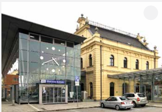
Moderní přístavba ke staré budově.