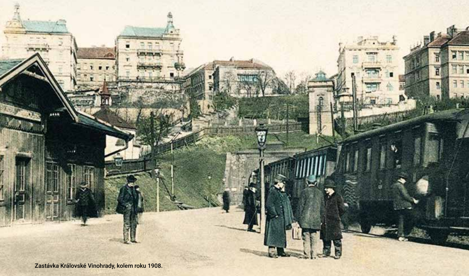
Zastávka Královské Vinohrady, kolem roku 1908.