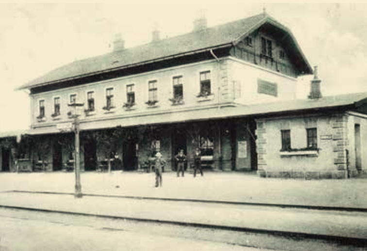
↑ Nádraží Hostivař, rok 1908.