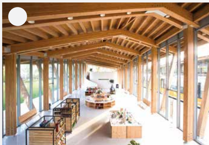
Vzdušný krytý prostor k posezení, čekání a pobytu (např. kavárna).

16 Připlula zlatá rybka a chce po vás popis toho, jak má vlakové nádraží v Uhříněvsi a prostor kolem něj (z obou stran kolejiště) změnit tak, aby bylo podle vašich představ. A nezapomeňte, zlatá rybka umí splnit jakékoliv přání!