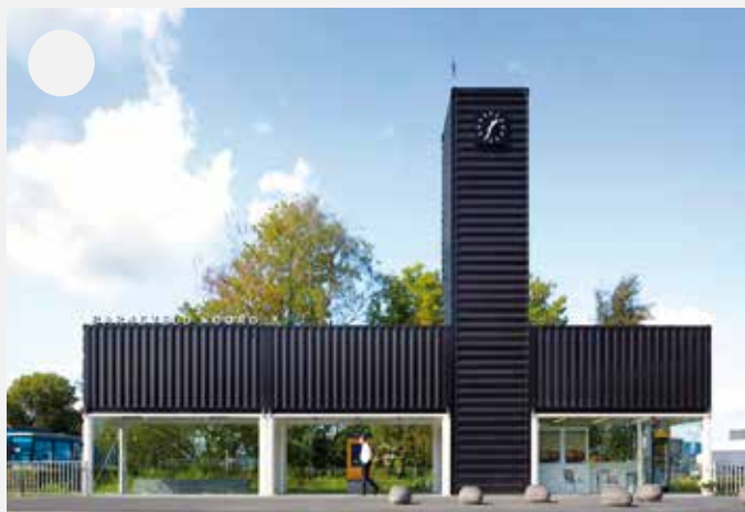
Zcela nová nádražní budova, možné využití i jako autobusová zastávka.

15 Oznámujte jako ve škole (1 – nejlepší, 4 – nejhorší) následující obrázky podle toho, jak se nejvíc blíží vaší představě o tom, že by přednádražní prostor a samotné nádraží v Uhříněvsi mohly jednou vypadat: