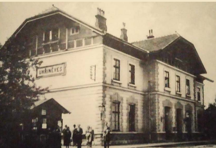
↑ Budova nového uhřetěveského nádraží s trafikou.