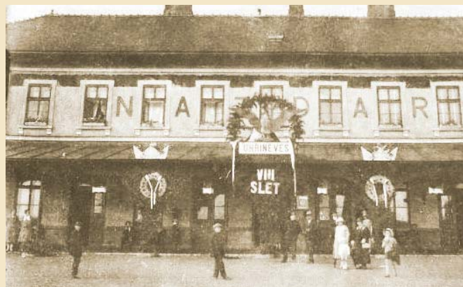
↑ Uhříněveské nádraží, ozdobené k VIII. všesokolskému sletu (1926).

Uhříněveská kronika přináší záznamy o dvou významných návštěvách, které se v Uhříněvsi zastavily při své cestě vlakem. Dne 20. října 1878 zastavil na uhříněveském nádraží vlak s korunným princem Rudolfem Habsburským, synem císaře Františka Josefa I.