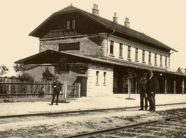
↑ Nová nádražní budova, kolem roku 1918.