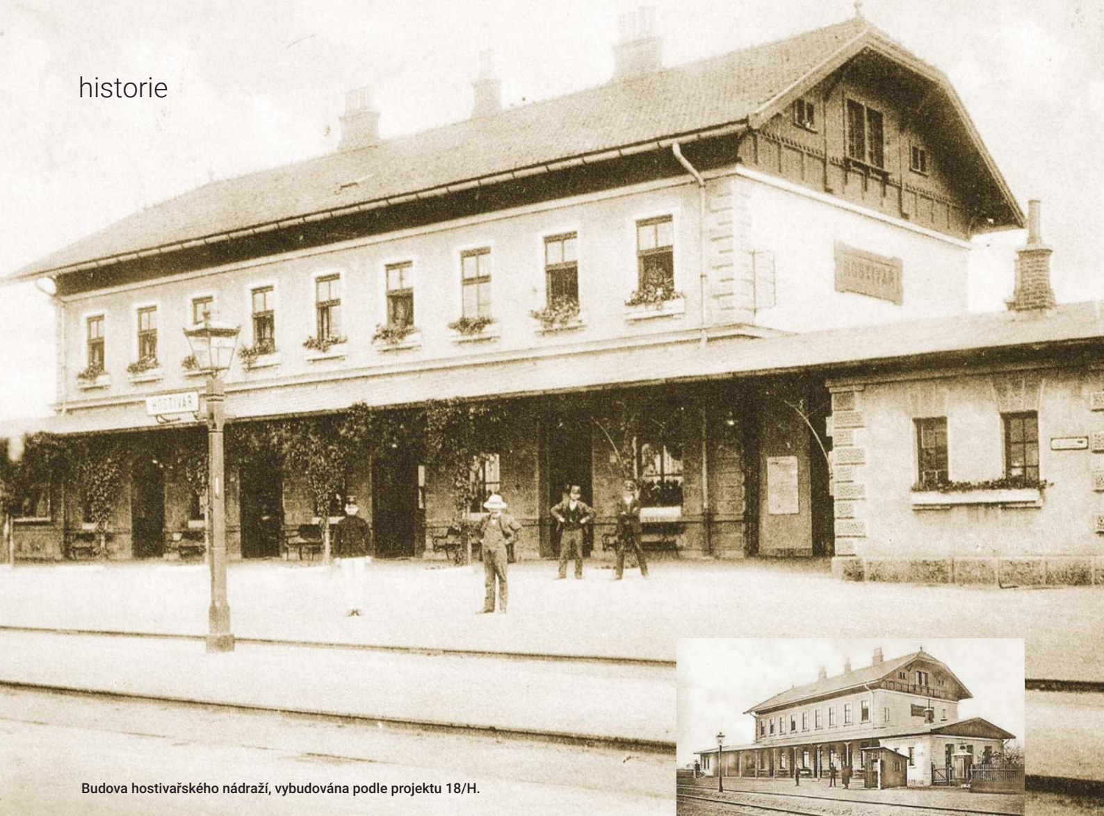
Budova hostivařského nádraží, vybudována podle projektu 18/H.