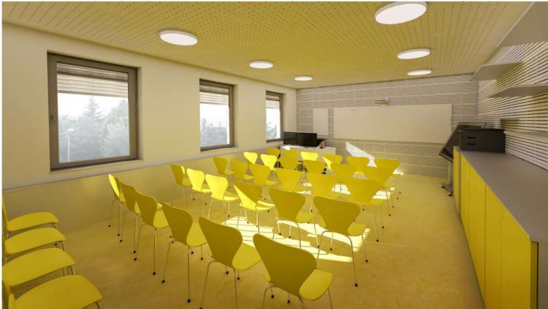
Vizualizace Centrum interaktivní výuky Mediální multifunkční učebna - pohled B