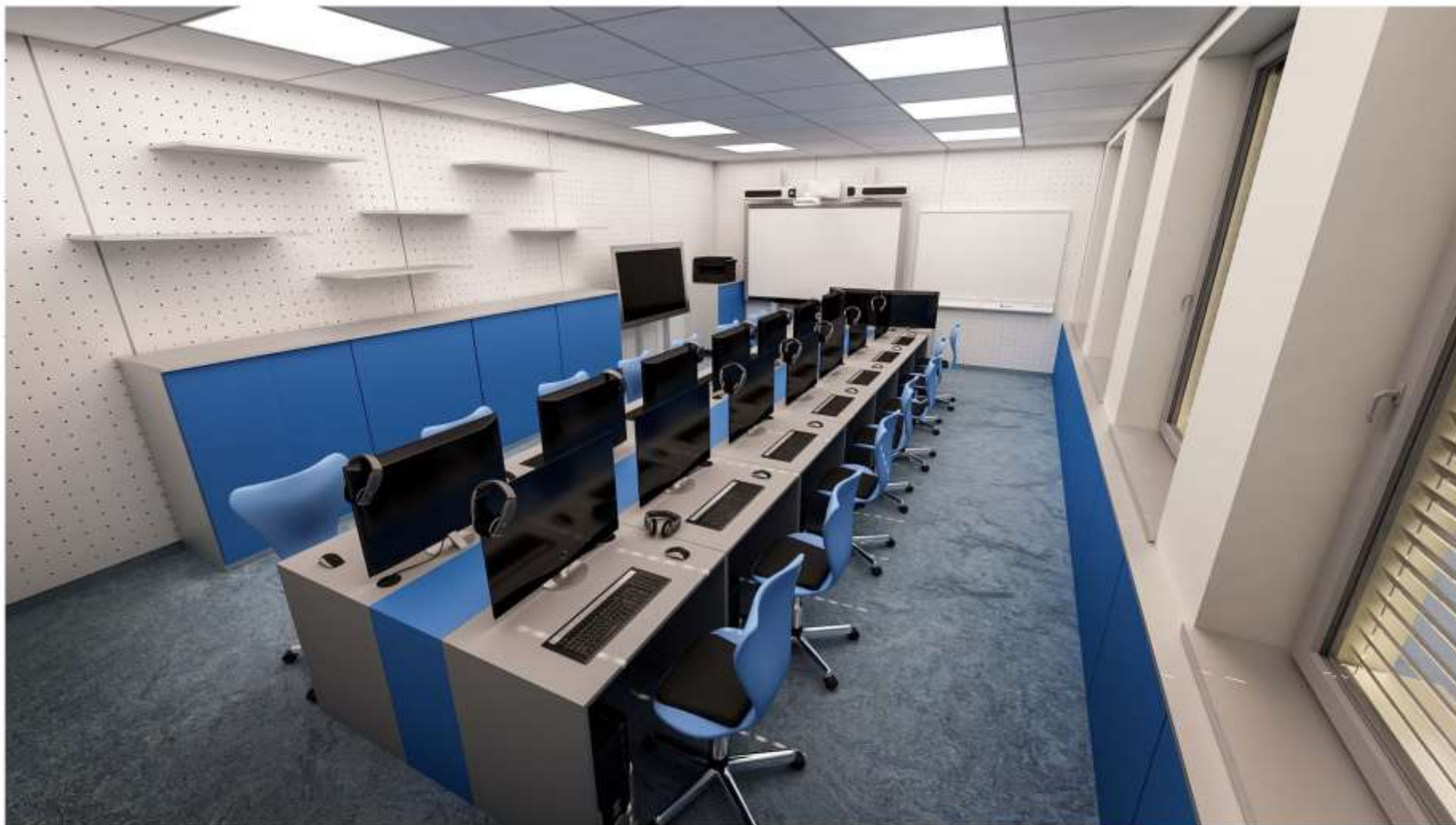
Vizualizace Centrum interaktivní výuky Stacionární digitální učebna - pohled A