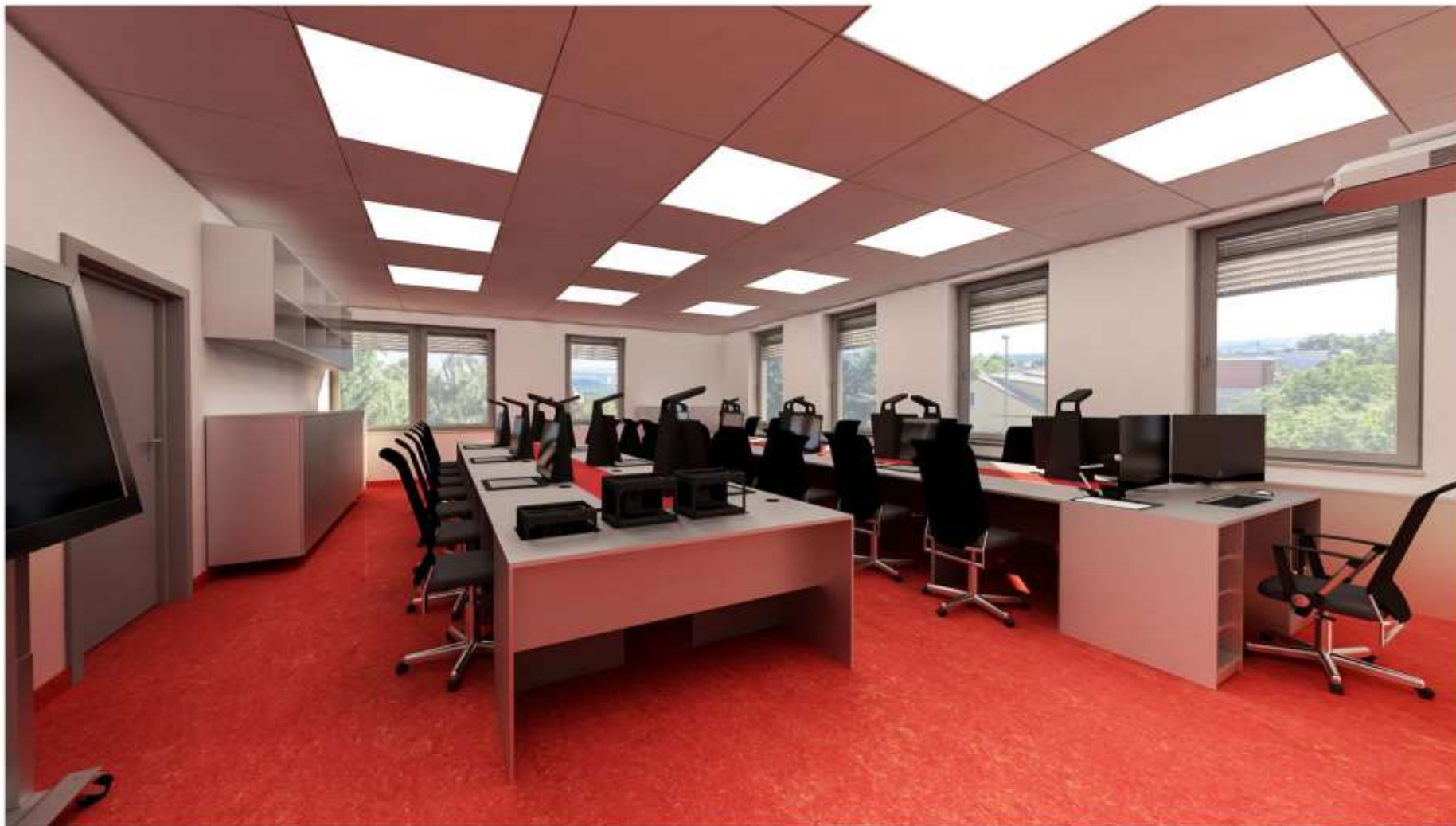
Vizualizace Centrum interaktivní výuky Odborná 3D učebna - pohled A